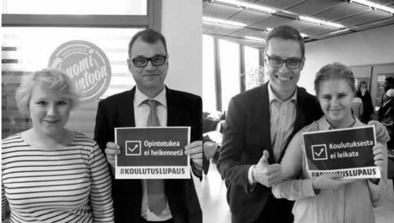
Juha Sipilä ja Alexander Stubb poseerasivat kevään 2015 vaalikampanjan aikoihin koulutuslupaus-kuvissa.

Yhdysvaltalaiset Putnam, Pharr ja Dalton löytävät kolmenlaisia syitä luottamuksen heikentymiselle länsimaisissa demokratioissa: muutokset kansalaisten tiedon määrässä ja laadussa, muutokset kansalaisten odotuksissa ja arviointikriteereissä, sekä edustuksellisen järjestelmän suoritustason heikkenemisen. Läpinäkyvyys ja aikaisempaa parempi tiedonsaanti ovat vaikuttaneet siten, että kansalaiset ovat paremmin tietoisia vallan väärinkäytöksistä. Postmaterialististen arvojen myötä kansalaisten poliittiset arvot ja tavoitteet ovat moninaistuneet ja pirstaloituneet, ja siten harvempi saa tahtonsa toteutumaan. Suoritustason heikkeneminen puolestaan voi johtua esimerkiksi kansallisvaltion kohdistuvista ulkoisista paineista tai itse poliittisista toimijoista. 51 Seurauksena on, että vuonna 2015 suomalaiset luottivat vain Euroopan unioniin vähemmän kuin poliitikoihin. Esimerkiksi ammattiyhdistysliikkeeseen, pankkeihin ja suuryrityksiin luotettiin poliitikkoja enemmän. 52