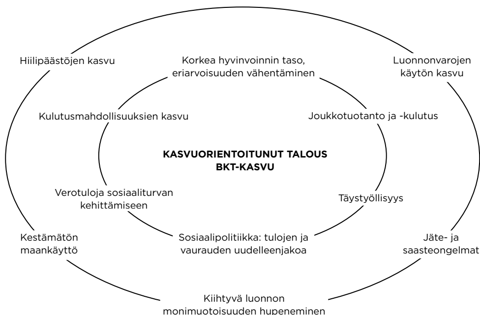
Kuvio 2. Hyvä kehä ekologisessa kriisissä.